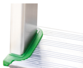
Embellecedores de peldaño. (2 und.) Guarnições de degraus. (2 unidade).