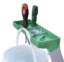
Bandeja portaobjetos. Bandeja porta-ferramentas.