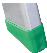
Taco 5x2 cm. (2 und.) Calço 5x2 cm. (2 unidade).